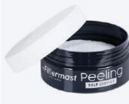
DR. FILLERMAST PEELING Self-service 45 ml 30 pad