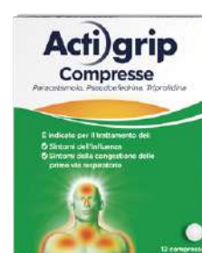
ACTIGRIP 2,5+60+500 mg 12 compresse