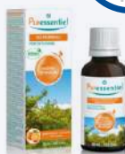
MISCELA VIAGGIO IN SICILIA OLI ESSENZIALI PER DIFFUSIONE 30 ml