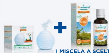
DIFFUSORE UMIDIFICATORE API + 1 MISCELA A SCELTA OLI ESSENZIALI PER DIFFUSIONE 30 ml