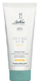
DEFENCE HAIR BALSAMO CREMA NUTRIENTE 200 ml