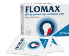
FLOMAX 350 mg GRANULATO 20 bustine