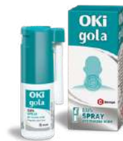
OKI GOLA 0,16% SPRAY 15 ml