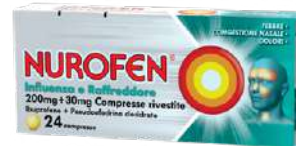
NUROFEN INFLUENZA E RAFFREDDORE 200 mg+30 mg 24 compresse