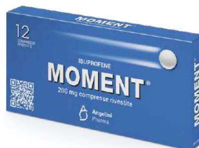
MOMENT 200 mg 12 compresse rivestite