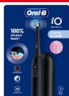
ORAL-B iO SERIES 2 SPAZZOLINO ELETTRICO Night Black + Travel Case