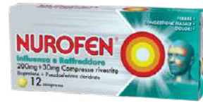
NUROFEN INFLUENZA E RAFFREDDORE 200 mg+30 mg 12 compresse