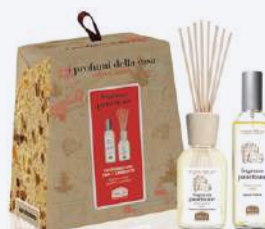
FRAGRANZA PANETTONE SET PROFUMATORI AMBIENTE