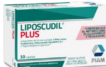
LIPOSCUDIL PLUS 30 capsule