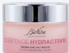
DEFENCE HYDRACTIVE CREMA IDRO-NUTRIENTE 50 ml