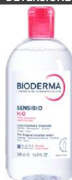
SENSIBIO H2O SOLUZIONE MICELLARE 500 ml