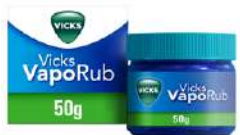
VICKS VAPORUB 50 g