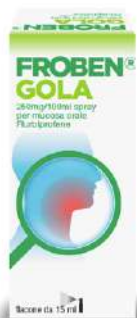
FROBEN GOLA 250 mg/100 ml SPRAY Flacone da 15 ml