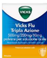
VICKS FLU TRIPLA AZIONE 500 mg/200 mg/10 mg 10 bustine