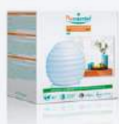
DIFFUSORE UMIDIFICATORE API