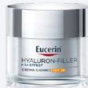
HYALURON-FILLER + 3X EFFECT CREMA GIORNO SPF30 50 ml