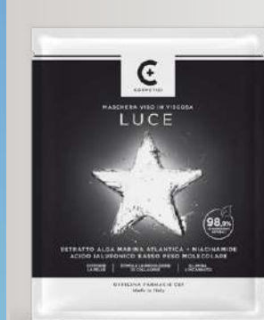
MASCHERA LUCE Tessuto