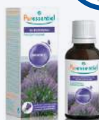
MISCELA PROVENCE OLI ESSENZIALI PER DIFFUSIONE 30 ml