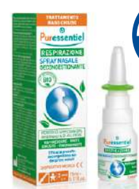
PURESSENTIEL RESPIRAZIONE Spray nasale decongestionante 15 ml