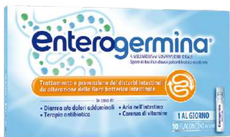
ENTEROGERMINA 4 MILIARDI/5 ml SOSPENSIONE ORALE 10 flaconcini

CONTINUA LA PROMOZIONE DI NOVEMBRE VALIDA FINO AL 31 DICEMBRE 2025