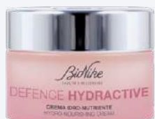
DEFENCE HYDRACTIVE CREMA IDRO-NUTRIENTE 50 ml