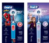
ORAL-B VITALITY PRO KIDS 3+ SPAZZOLINO ELETTRICO • Spiderman • Frozen

**CASHBACK ORAL-B PHARMA* valida dal 01/07 al 31/12/25 in farmacia/parafarmacia/sanitaria. Conserva lo scontrino e chiedi il rimborso entro 15 gg previa registrazione/accesso a P&G Per Te. Prodotti coinvolti, combinazioni di acquisto e Termini e condizioni su www.cashbackoralb.pgperite.it