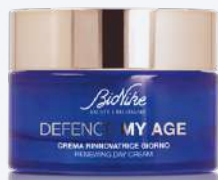
DEFENCE MY AGE CREMA RINNOVATRICE GIORNO 50 ml