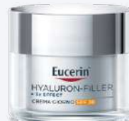
HYALURON-FILLER + 3X EFFECT CREMA GIORNO SPF30 50 ml