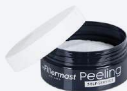
DR. FILLERMAST PEELING Self-service 45 ml 30 pad