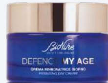
DEFENCE MY AGE CREMA RINNOVATRICE GIORNO 50 ml