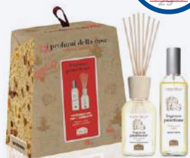
FRAGRANZA PANETTONE SET PROFUMATORI AMBIENTE