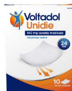
VOLTADOL UNIDIE 140 mg 10 cerotti medicati