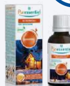
MISCELA COCOONING OLI ESSENZIALI PER DIFFUSIONE 30 ml