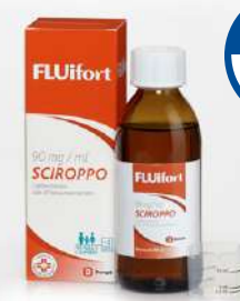
FLUIFORT 90 mg / ml SCIROPPO Flacone da 200 ml