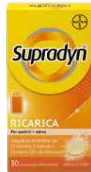
SUPRADYN RICARICA 30 compresse effervescenti