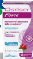
CISTISSET FORTE 10 Stick orolubili da 2,5 g