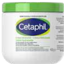
CETAPHIL CREMA IDRATANTE 450 g