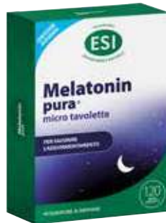
ESI MELATONIN PURA 120 micro tavolette