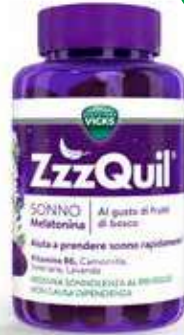
VICKS ZZZQUIL SONNO MELATONINA