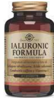
IALURONIC FORMULA 30 tavolette