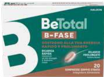
BETOTAL B-FASE 20 compresse doppio strato