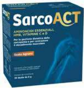
SARCOACT 30 buste da 8 g gusto agrumi