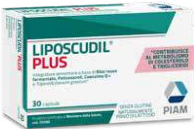
LIPOSCUDIL PLUS 30 capsule