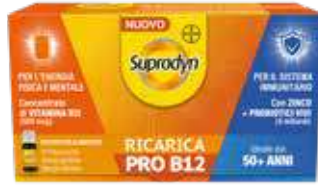
SUPRADYN RICARICA PRO B12 10 flaconcini