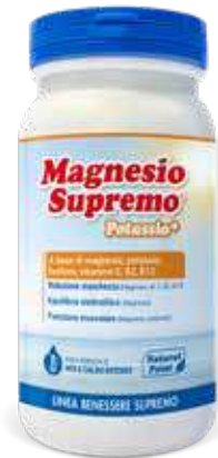
MAGNESIO SUPREMO POTASSIO+ • 150 g • 24 bustine