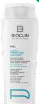
BIOCLIN PRO SHAMPOO DERMATOLOGICO ultradelicato addolcente 400 ml