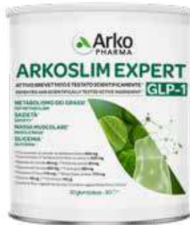
ARKOSLIM EXPERT GLP-1 270 g