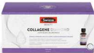
SWISSE COLLAGENE DIAMOND 10 flaconcini da 30 ml

CONTINUA LA PROMOZIONE DI MAGGIO VALIDA FINO AL 30 GIUGNO 2026