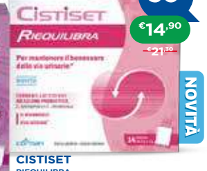
CISTISSET RIEQUILIBRA 14 bustine da 2 g + 2 g